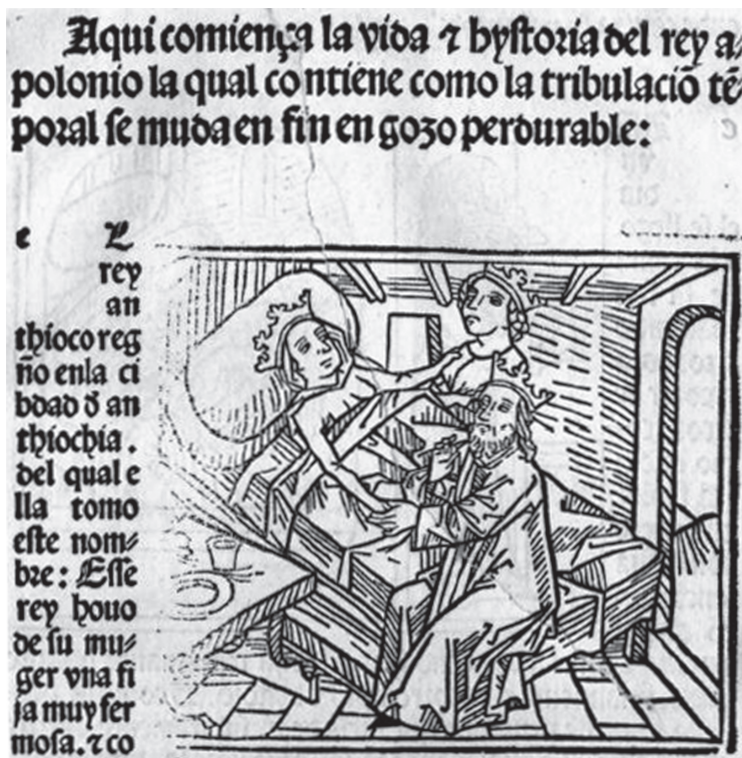
Ilustración 2: Vida e historia del rey Apolonio [Zaragoza: Juan Hurus, ca.1488]. Incipit. Nueva York, HSA.

Dinckmut, 1495), pero con grabados copiados toscamente, incluso, en algún caso parcialmente modificados, para introducir elementos cristianos.