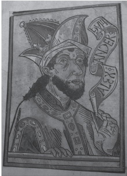
Ilustración 3: Steinhöwel, Heinrich, Die hystori des küniges Appoloni , Augsburgo: Johann Bämler, 1476. Portada. Berlín, SBB, Inc.73.