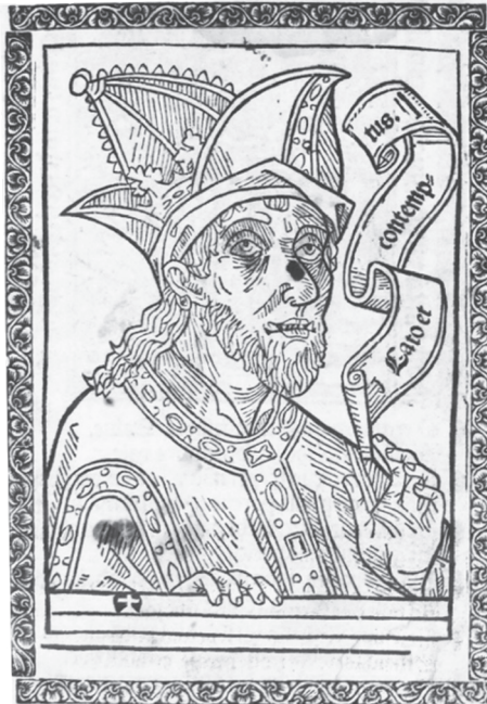
Ilustración 4: Catón, Cato et contemptus , Zaragoza: Jorge Coci, 30 de mayo de 1508. Portada. Zaragoza, BUZ, An_7_5_18.