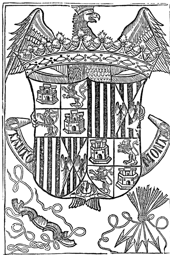
Figura 4. Escudo de la portada de la Valeriana o Crónica abreviada de España de Diego de Valera, Salamanca, Juan de Porras, 20 de enero de 1499.

César Domínguez (2000), en un documentado trabajo en el que cita buena parte de los materiales que hemos empleado, trató de explicar las características y novedades de la edición de La gran conquista de Ultramar como influjo del original y del género editorial caballeresco. Sin embargo, las primeras publicaciones caballerescas impresas se ilustraban con grabados interiores, sea la Historia de la linda Melusina (Tolosa: Juan Parix y Esteban Clebat, 1489, 14 de julio), el Baladro del sabio Merlín (Burgos: Juan de Burgos, 1498, 10 de febrero), el Oliveros de Castilla (Burgos: [Fadrique Biel de Basilea], 1499, 25 de marzo), o el Tristán de Leonís (Valladolid: Juan de Burgos, 1501). Alguno de ellos incluso está relacionado con La gran conquista de Ultramar , o al menos con el Caballero del Cisne (figura 5), antes de que se imprimiera en Salamanca, lo que implica la posibilidad de que hubiera existido una edición anterior, y en consecuencia algunos de sus paratextos, hipótesis que no voy a desarrollar.