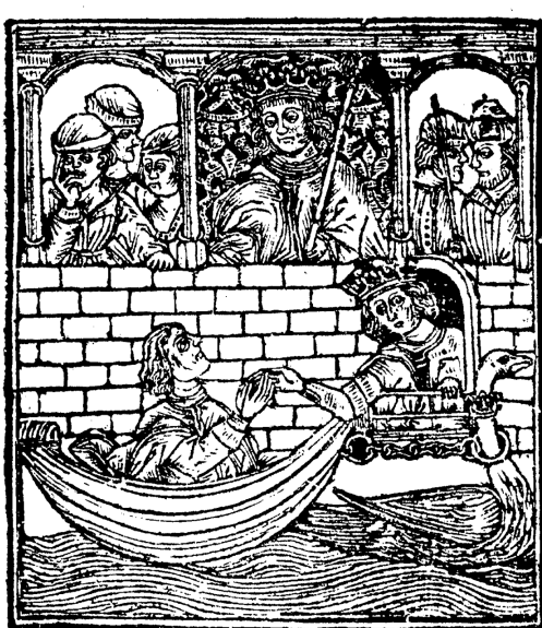
Figura 5. Grabado interior del Tristán de Leonís , Valladolid, Juan de Burgos, 1501, fol. xviv.

Sea como fuere, en su aspecto material la edición salmantina de Giesser no asume esta herencia, mientras que se explica coherentemente desde la tradición manuscrita y desde la Valeriana , con la que coincide en el uso de idéntico grabado y en la misma repartición en cuatro libros. Incluso me atrevería a ir más lejos: la obra de Valera tuvo que ser un modelo editorial, que no olvidemos coincide con textos de otros géneros, pero fue el primero que se configuró en la historiografía romance y extendió con gran éxito. En su paradigma, los modelos cronísticos no difieren de los libros de caballerías, pero ambos deben estudiarse en su diacronía pues son géneros que desde su disposición material van evolucionando. Con el Amadís , del que desconocemos por completo las ediciones anteriores a 1508, se hicieron pasar por historias fingidas, por lo que no es de extrañar que prosiguieran empleando un tipo de formato avalado por el prestigio de la historia. A mi juicio, Giesser no es el principal responsable de un cambio genológico de La gran conquista de Ultramar : la edita de acuerdo con el paradigma cronístico de la Valeriana , cuya portada también se va modificando especialmente de 1482 a 1493.