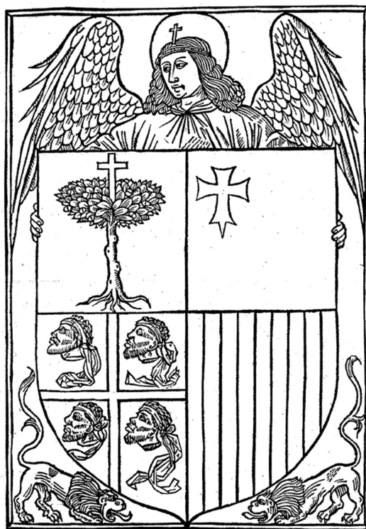
Crónica de aragon,

En el limitado panorama de las crónicas aragonesas medievales (Orcástegui, 1986), la obra de Vagad destaca por ser la primera de carácter general impresa en romance, cuyo contenido abarca desde los míticos tiempos del reino de Sobrarbe hasta el final de Alfonso v (1458), a lo que preceden tres extensos prólogos laudatorios en los que «sostiene con rotundidad su aragonesismo y la preeminencia de Aragón sobre los demás reinos hispánicos» (Orcástegui, 1996: 25). El primero corresponde a los loores de España y el segundo a los de Aragón, mientras que su tercera entrada pretende «sentir la excellencia de la historia de Aragón» (fol. B2v), insistiendo sobre todo en las excelencias de Huesca y en especial de Zaragoza.