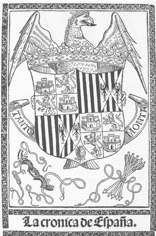
Figura 1. Portada de la Valeriana o Crónica abreviada de España de Diego de Valera, Zaragoza, Pablo Hurus, 24 de septiembre de 1493.

Uno de los primeros modelos de este tipo, el 17b en la Tipología de Elisa Ruiz, lo imprimió Pablo Hurus en Zaragoza el 24 de septiembre de 1493 (figura 1). Unos años después, se publicarán dos obras cuyas portadas permiten proyectarlas en una primera aproximación sobre la Valeriana , bien por identificación ( Gran conquista de Ultramar ), bien por contraste ( Crónica de Aragón ), indicio de otros sustratos.